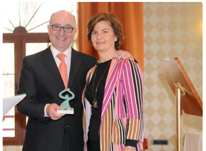
Nina Torres Hotel Cortijo El Sotillo (San José – Níjar)