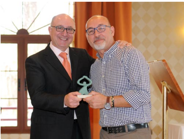
Francisco Nieto Bar El Cabo (Cabo de Gata – Almería)