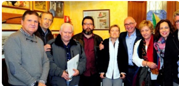
En la foto, miembros del jurado acompañados de directivos y personal de Ashal

Del 21 de marzo al 7 de abril, la Ruta De Tapas por Almería, Declarada recientemente de Interés Turístico de Andalucía, contó con la colaboración de más de 60 establecimientos asociados de las distintas zonas de la capital almeriense con notable éxito de público.