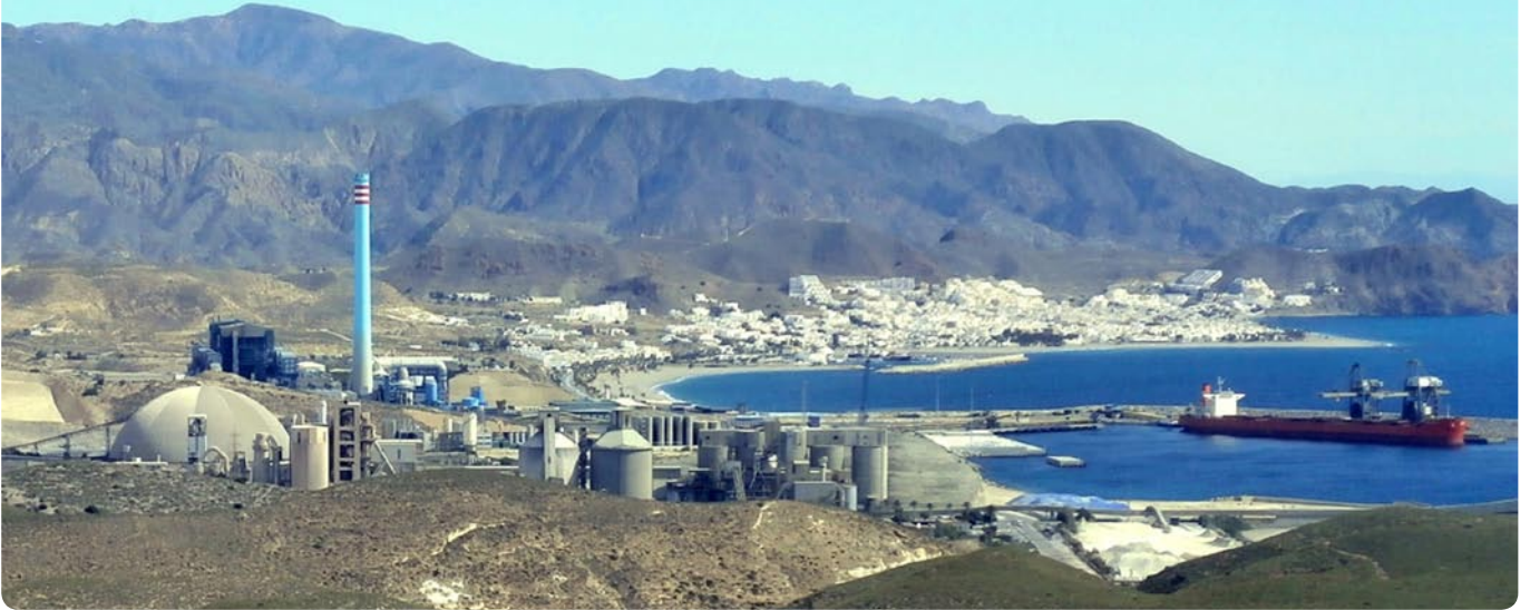
Puerto Comercial de Carboneras.

Debido a la grave contaminación por partículas que genera esta actividad