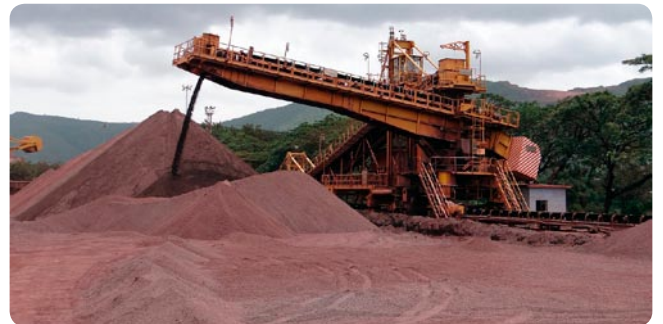
Mina de hierro de Alquife (Granada).

La contaminación que produce este tipo de actividad es principalmente una gran emisión de polvo rojo que lo cubre todo y produce graves efectos sobre la salud, razón por la