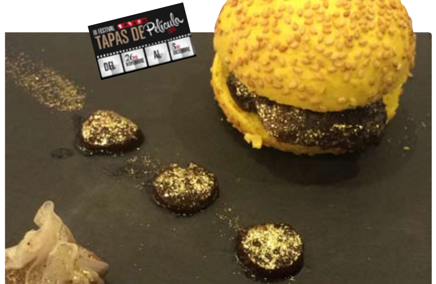
Restaurante La Tahona Plaza Vieja se ha hecho con el Sol de Oro por la tapa denominada ‘Por un puñado de dólares’.

Whatsabi Sushi & Tapas y Taberna Restaurante La Encina se hacen con la Plata y Bronce, respectivamente.