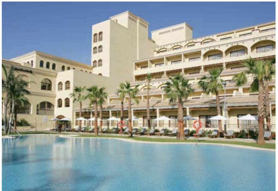
Hotel La Envía

El pasado 6 de Noviembre en la Asamblea General de HOTREC celebrada en la Haya (Holanda) se anunció que Liechtenstein es el último país en incorporarse al sistema clasificatorio común (convirtiéndose en