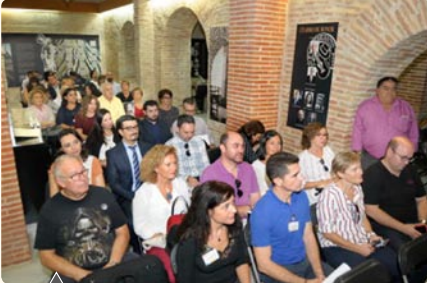
Jornada con empresas del Secretariado General Gitano "Juntos creando empleo"