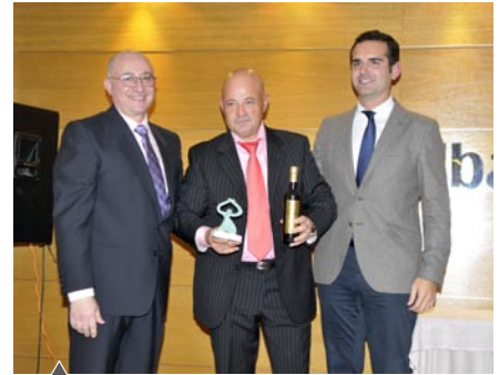
Restaurante Valentín (Almería)