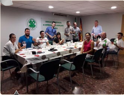
Jornada de coctelería con Diageo y Atalaya Distribución en la sede de la asociación.