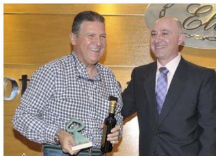
Bar Quinto Toro (Almería)