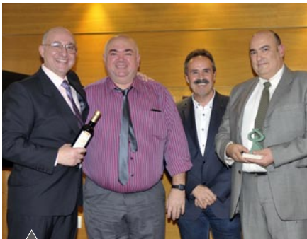
Restaurante El Retirno (Almería)