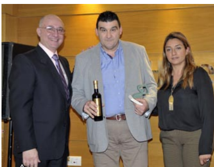
Bar Principe I (El Ejido)