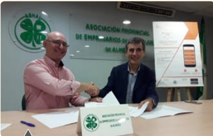
Jornada informativa "YoQuieroLoMio" y renovación del convenio de colaboración con Consultores de Gestión, COGESA, en ASHAL