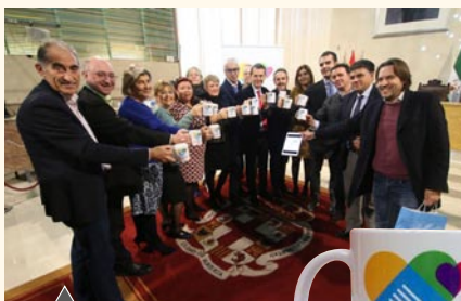
Presentación de la candidatura de Almería a la capitalidad Española de la Gastronomía

Entre las cuestiones debatidas al margen del proceso electoral se tuvo una especial atención a la situación en la que se encuentra el borrador del Decreto que está elaborando la Junta de Andalucía y que pretende regular las modalidades y condiciones de celebración de espectáculos públicos y actividades recreativas, los tipos de establecimientos públicos, su régimen de apertura o instalación, los horarios que rigen su apertura y cierre, y se aprueban el Nomenclátor y el Catálogo de Espectáculos Públicos, Actividades Recreativas y Establecimientos Públicos de Andalucía, ya que a juicio del sector se trata de la norma que va a marcar y definir el futuro del sector por lo que se seguirá trabajando, tal y como se ha venido haciendo hasta el momento, para propiciar el mejor de los escenarios que permita el desarrollo y mejora de una actividad económica de tanta relevancia en nuestra Comunidad Autónoma como es la actividad hostelera.