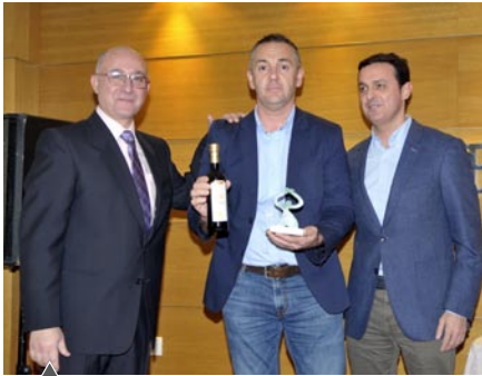
Bar La Frontera (Carboneras)