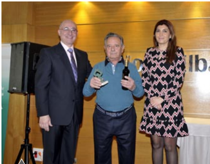
Restaurante El Parque (La Almadraba)