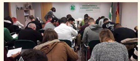
Curso de Manipulador de Alimentos en ASHAL.