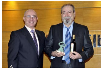
Restaurante Quesería Galatea (Almería)