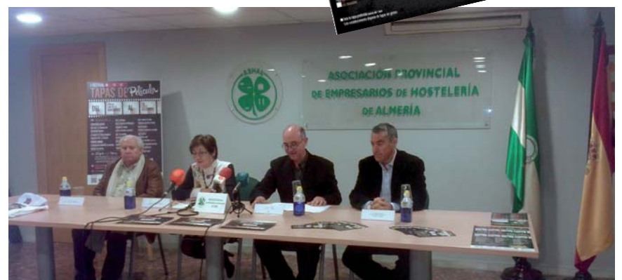
Acto de inauguración en la sede de Ashal