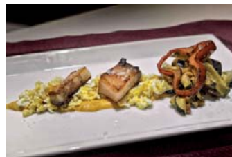
Tahona Plaza Vieja