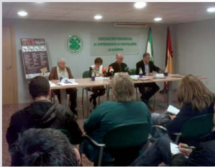
Los establecimientos que han participado en esta primera edición han sido: