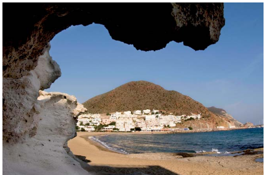
San José, Patronato Provincial de Turismo

Podéis consultar toda la info en www.ashal.es – noticias legislación.