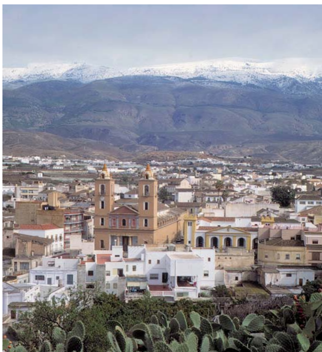
Vélez Rubio, Patronato Provincial de Turismo

En conclusión, las ordenanzas reguladoras de la tasa por recogida de basura de ambos Consorcios agravan la presión fiscal que sufre el sector hotelero y hostelero de los municipios afectados, lo que implica unas consecuencias negativas para la competitividad de sus empresas turísticas, por lo que –entendemos– la solución en la prestación del servicio de recogida de basura no está en la presión fiscal, sino en una reestructuración del servicio en su conjunto y a su adaptación a las actuales circunstancias de crisis económica.